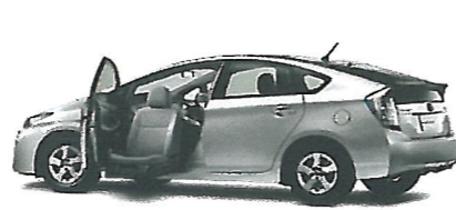
プリウス助手席リフトアップシート車

エスティマサイドリフトアップシート車 アイシスサイドリフトアップシート車 ポルテ助手席リフトアップシート車 ダイハツタントスローパー