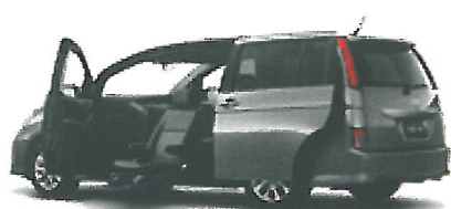
アイシスサイドリフトアップシート車