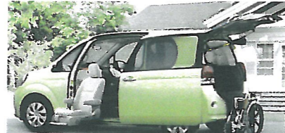
ポルテサイドリフトアップシート車